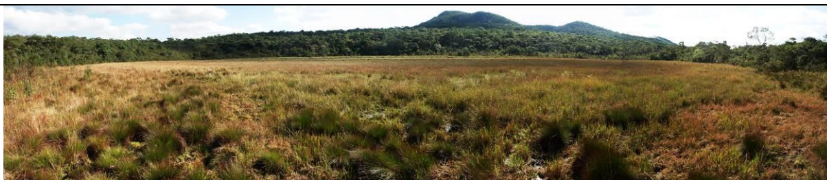
Figura 8: Vista panorâmica da Depressão Fechada

Acesso: Razoável. Sítio localizado na margem de estrada interna do Parque Nacional da Serra do Gandarela. Entretanto, esta estrada não está pavimentada.