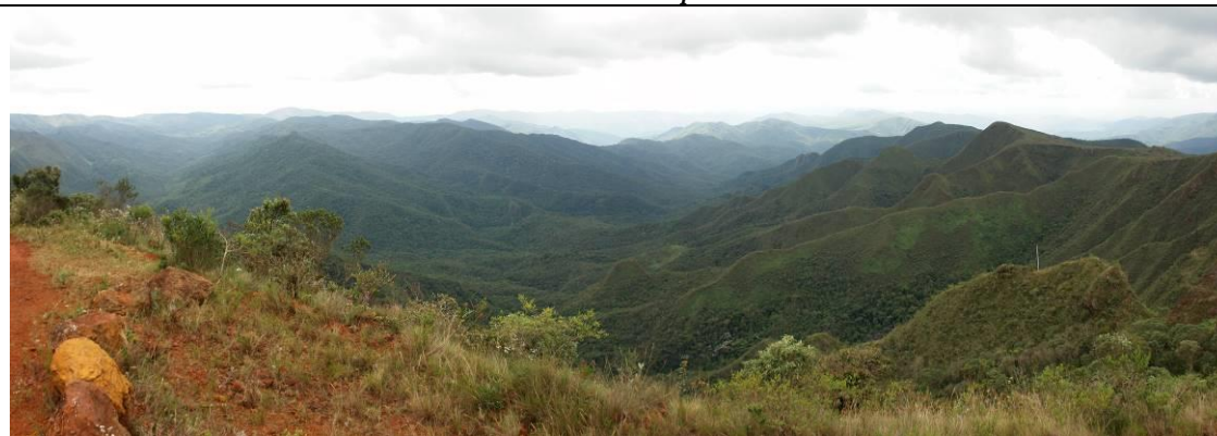
Figura 6: Sinclinal Suspenso do Gandarela

Acesso: Razoável. Sítio atravessado por estrada interna do Parque Nacional da Serra do Gandarela. Entretanto, esta estrada não está pavimentada, alguns trechos que percorrem o sítio necessitam de melhorias para possibilitar o tráfego de veículos.