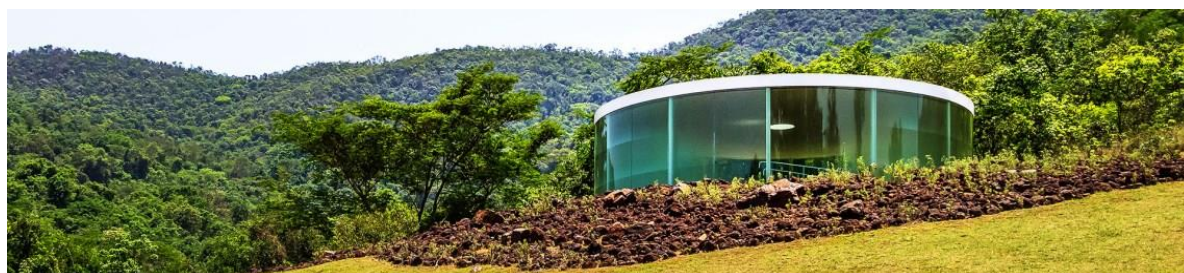
Figura 10: Exposição no Instituto Inhotim.

Acesso: Fácil. Existe uma estrada bem sinalizada que permite a ônibus, vans e carros de passeio chegarem até a portaria do Instituto, onde há um amplo estacionamento.