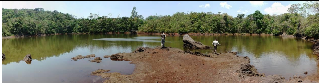
Figura 7: Exposição de canga na lagoa do Metro

Acesso: Razoável. Sítio localizado na margem de estrada que faz a ligação entre municípios. Entretanto, esta estrada não está pavimentada, apresentando trechos necessitando de melhorias para o acesso de ônibus.