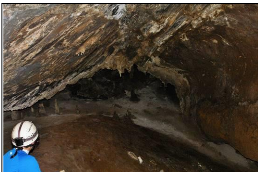
Figura 5: Interior da Caverna do Contato. Observar dolomitos no teto.

Acesso: Difícil. Sítio localizado a cerca de 50 metros de estrada interna do Parque Nacional da Serra do Gandarela. Esta estrada era utilizada para atividades de mineração. Com o fim destas atividades, a estrada foi abandonada, levando à sua precarização. Atualmente, precisa de melhorias para possibilitar o acesso de veículos.