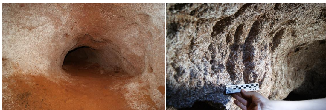
Figura 4: Entrada da paleotoca (à esquerda) e detalhe de marca de garra produzida pela megafauna extinta (à direita).

Acesso: Fácil. A paleotoca está situada às margens de uma estrada vicinal que pode ser acessada pelo município de Rio Acima. Por não haver estrada asfaltada, o acesso pode ser dificultado durante o período de chuvas.