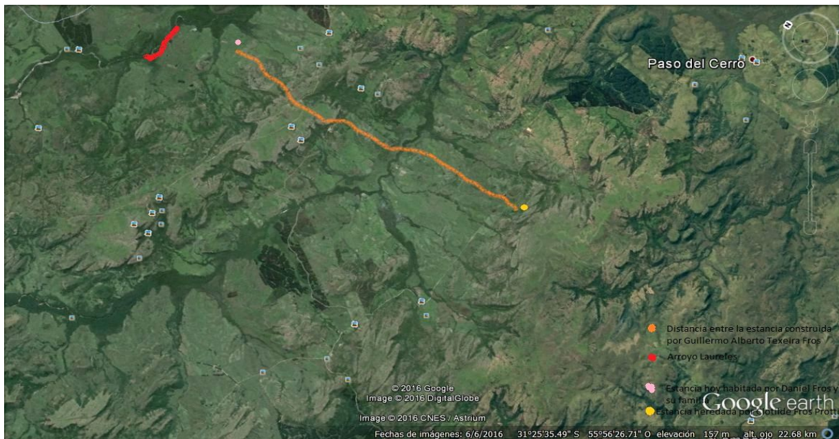
Mapa-2- Google earth. Distancia entre las dos estancias de la familia Fros