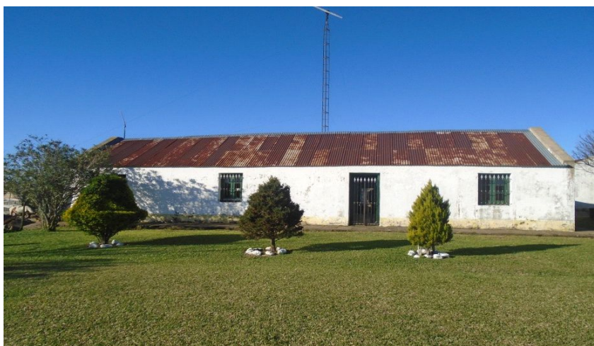
Foro- 4- Estancia de propiedad Fros en Laureles.

Según los entrevistados con el apellido Fros la fotografía remite a la Primera Estancia construida en piedra. “Laureles allí, después por el año 1865, 1866 construyó donde hoy es el establecimiento y más tarde, exactamente en el año 1869 construyó la otra parte de la casa” (D.F, 08/2016).