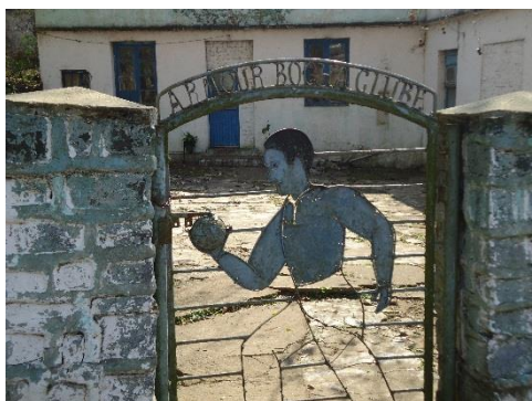
Foto 16: Portón de entrada al club de Bocha.

Se percibe una frontera abierta ya que personas de otros países, principalmente de Uruguay pasan a vivir allá, se comienzan a producir relaciones sociales y de trabajo. La producción y modificación del territorio se percibe en el momento de la construcción de las casas, donde se puede notar también jerarquizaciones en la construcción y ubicación de esas