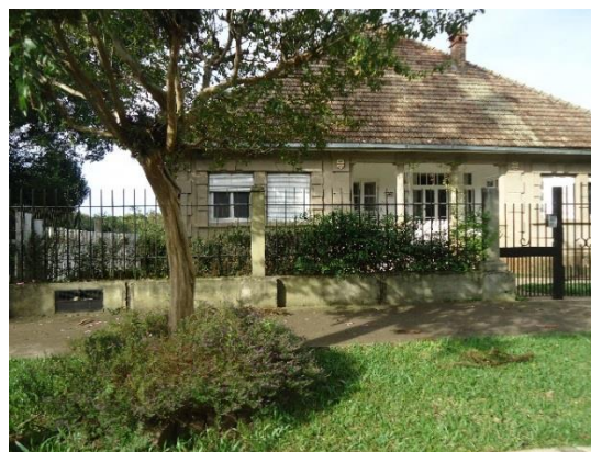
Foto 6: Casa de funcionarios de alto escalafón, Primera Avenida. Fuente: Archivo personal, 2016