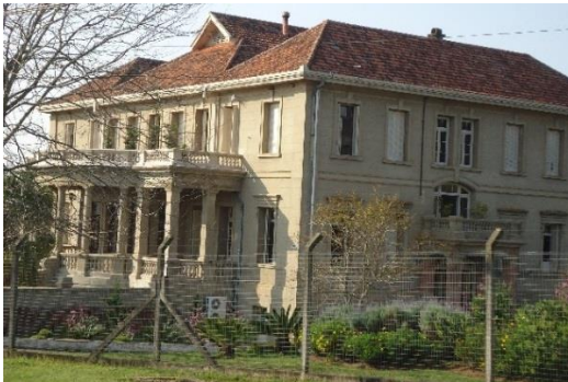
Foto 3: Edifício de la antigua Administración.