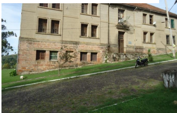
Foto 7: Edificio apartamentos para los solteros.

Volviendo a la calle paralela al frigorífico nos alejamos unos metros y se encuentran la segunda y tercera avenida, donde se encuentran las casas de los obreros casados, estas casas “se implantan en pares, conservando tres aislamientos, al frente, al fondo y a uno de los lados” (BELTRAMI y BRAGHIROLI, op, cit , p. 82). Así como las casas de los altos funcionarios como de los trabajadores estaban y aún están “rodeadas de áreas verdes y sus tejados a dos aguas presentan intercaladamente las cumbres paralelas y perpendiculares a la calle” ( Loc, cit ).