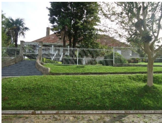
Foto 5: Casa de exgerente, Primera Avenida.