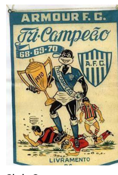
Foto 13: Canch - de 2016 Club Copatti Fuente: Archiv Foto 15: Escudo. Fuente:

Otras actividades que eran realizadas por funcionarios del Frigorífico era el Fútbol, el equipo fue creado en 1917, y el Estadio Miguel Copatti inaugurado el mismo año. Además un club de bochas en el mismo edificio del frigorífico. Albornoz (Entrevista personal, 09/2016) en entrevista personal nos dijo que el futbol era la actividad de los obreros, incentivados si por el escalafón de funcionarios especializados pero que no jugaban, porque quién deseaba subir en la empresa debería jugar golf o tenis. Albornoz (Entrevista personal, 09/2016) también nos comentó sobre una entrevista realizada a un funcionario del Armour que debido a problemas familiares fue contratado como mensajero a los 11 años por uno de los funcionarios de alto escalón, que le dijo que si él deseaba subir en la vida, no debería jugar el Fútbol que dejara para los “negros”, que tenía que aprender a jugar al golf o tenis. Este niño creció dentro de la empresa, llegando a ser un alto funcionario.