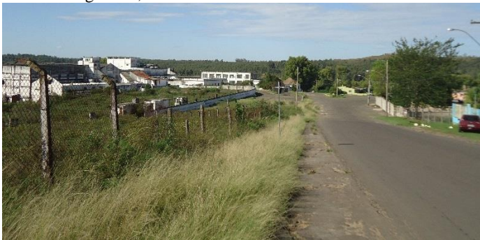
Foto 2: Avenida Francisco Reverbél de Araújo Góes, acceso al barrio

Foto 1: Vista aérea general del complejo del frigorífico Armour.