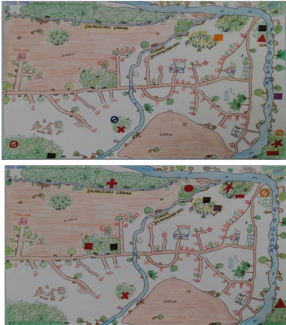
Figura 2 – Cartografias desenhadas a partir dos entrevistados 3 e 4 que caçam, representando áreas de ocorrência de etnoespécies e elementos da paisagem quilombola.