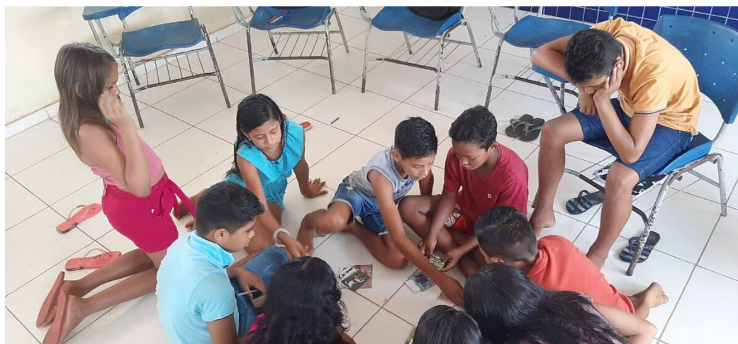
Figura 4 – Gravuras de animais distribuídos para os discentes da escola

que permitiu aos educandos a troca de conhecimentos com seus colegas, a exposição de curiosidades, o compartilhamento de experiências, e o relato de situações vivenciadas no seu dia a dia, como histórias e lembranças de terem visto determinados animais na comunidade. Alguns lembraram que a caça é uma atividade cultural praticada pela própria família, pois, conforme citaram, eles comumente veem pais, irmãos, tios, entre outros moradores do quilombo praticarem tal atividade; ou mesmo teve os que puderam acompanhá-los em caçadas. Esse tipo de transmissão cultural é comum entre povos e comunidades tradicionais, o que se dá entre gerações, principalmente através da oralidade. Sendo, portanto, um conjunto de significações, as quais refletem nas memórias e identidades, além de contextualizarem o território como espaço de conexão e tradição cultural (Souza; Landim; Ferreira, 2022).