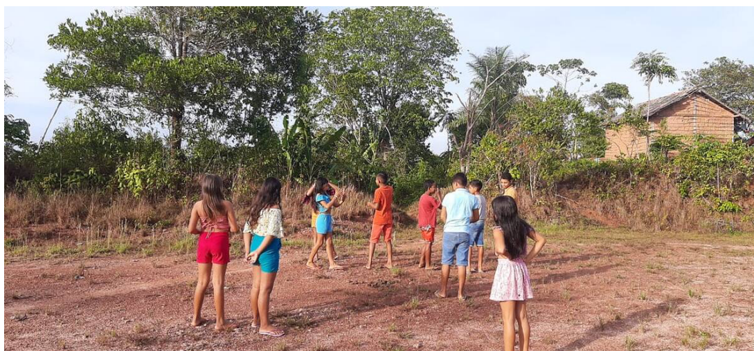
Figura 3 – Atividade na área externa da escola do quilombo Jacarequara

Ao serem instruídos para a etapa posterior, o intuito era também de deixá-los à vontade, de modo a dar espaço para a desenvoltura e total engajamento deles nos procedimentos. Para isso, optou-se pela distribuição de algumas figuras impressas de etnoespécies da fauna silvestre que ocorrem no território, as quais foram selecionadas a partir dos resultados obtidos com os entrevistados que ainda caçam na comunidade. Além delas, foram incluídas também figuras de animais domésticos. O intuito foi de compreender o que as crianças sabiam a respeito do assunto, considerando as classificações delas para animais silvestres e domésticos. Essa mediação ocorreu de forma processual, sendo uma importante estratégia de avaliação, possibilitando conhecer seus conhecimentos e habilidades relacionados à referida temática. Partindo das indagações, foi possível perceber quais etnoespécies da fauna elas conheciam e, dependendo da necessidade, sempre se apresentavam alguns conceitos, explicando de forma objetiva e procurando trazer exemplificações do cotidiano para melhorar a abordagem. Atividades pedagógicas como esta são importantes recursos estimuladores da reestruturação das práticas de ensino, colaborando para uma educação mais sensível aos conhecimentos e práticas de povos e comunidades tradicionais (Zank et al. , 2023).