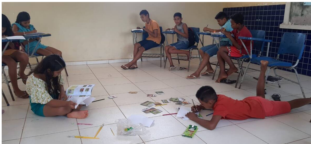
Figura 5 – Discentes desenhando animais silvestres, como parte da atividade proposta