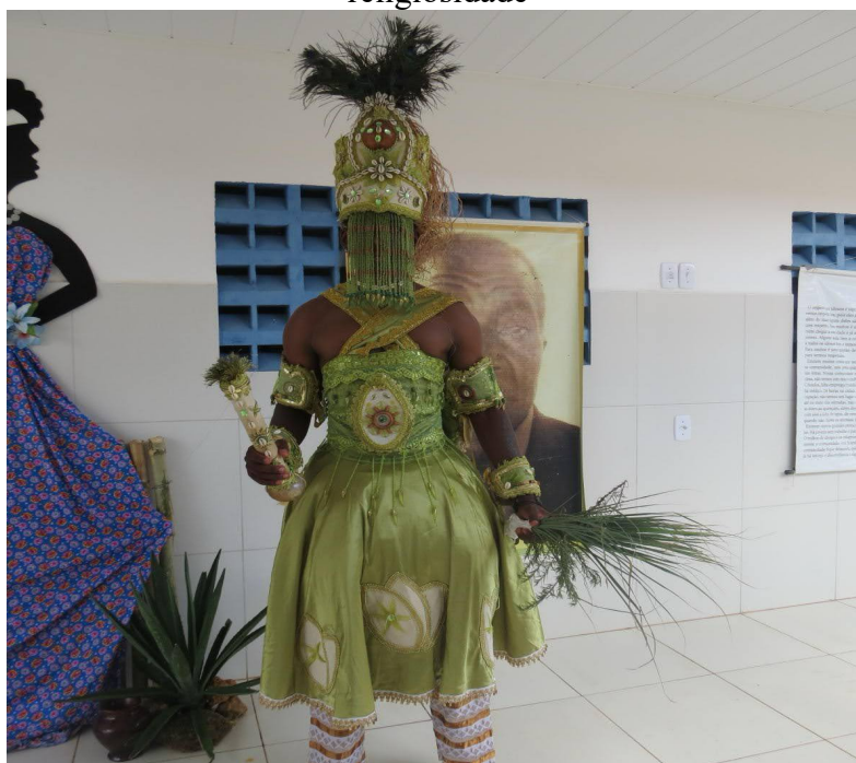
Figura 06 - Apresentação da dança do Orixá Ossain - valor religiosidade