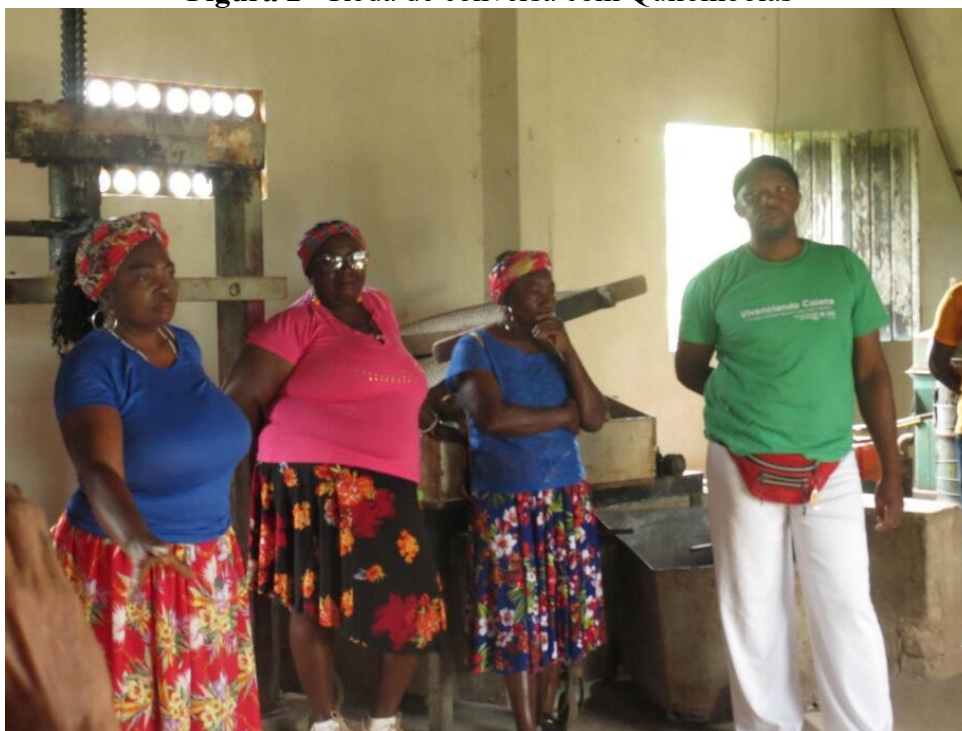
Figura 2 - Roda de conversa com Quilombolas

A “oralidade” diz sobre o destaque e relevância da transmissão oral dos conhecimentos, tradições, histórias e valores compartilhados pelos/as mais velhos/as. Durante o Vivenciando Caiana, os saberes tradicionais e o cotidiano - de antigamente e do presente - são narrados não apenas pelas pessoas, mas também pela natureza e pelo território.