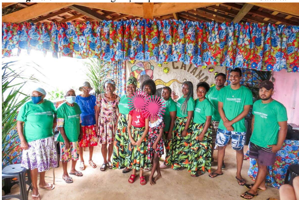
Figura 02 - Diferentes gerações presentes no Vivenciando Caiana

A “circularidade” está compreendida na percepção cíclica do tempo, onde passado, presente e futuro estão interligados, em contraste com a visão linear do tempo em algumas culturas ocidentais. A presença de diferentes gerações que, a sua maneira, demonstram interagir com os saberes e tradições, elucidam, assim, esse valor durante o evento.