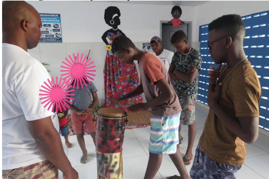
Figura 07 - Toques da capoeira - valor ancestral

A “ancestralidade” aparece como enaltecimento dos antepassados, respeito e reverência pelas “raízes culturais e saberes tradicionais”. No evento do Vivenciando pode ser notado a presença e lugar de destaque dado às mais velhas na hora de narrar as histórias, além do respeito e cuidado dos mais novos/as ao se dirigirem, às pessoas mais velhas. É possível ver crianças, jovens e adultos/as o tempo todo pedindo a bênção dos/as mais velhos/as. A capoeira também é entendida como ancestralidade.