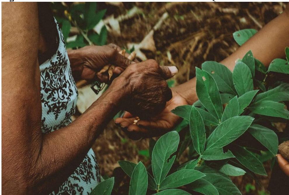
Figura 10 - Sementes da ervilha africana conhecida no Quilombo com Gandú