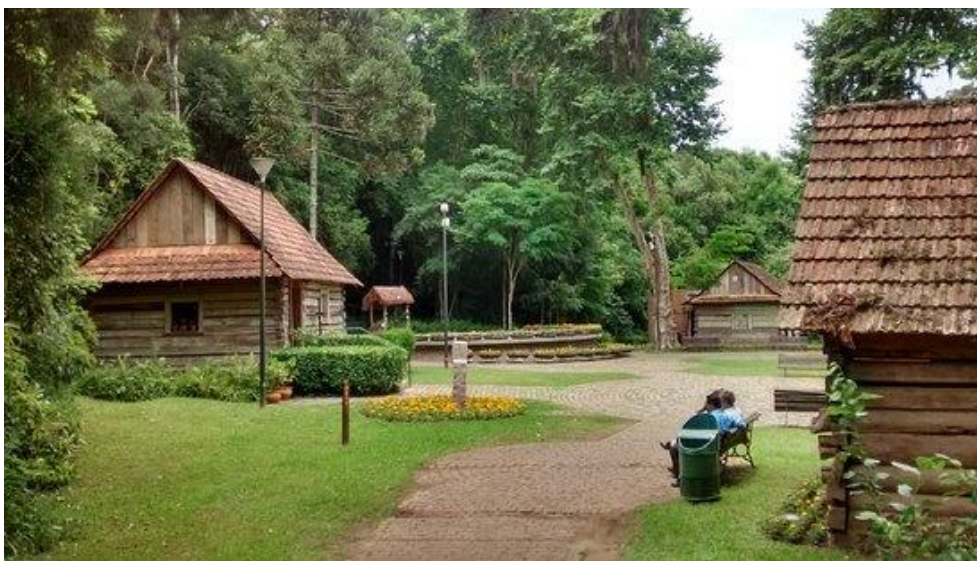
Figura 3 – “Bosque João Paulo II” / Memorial de la inmigración polaca

De modo a ilustrar este apuntamiento sobre la resignificación de sitios urbanos en función de herencias culturales étnicas y su materialización por la actividad turística, las figuras 3 y 4 ejemplifican la herencia cultural étnica polaca en la ciudad de Curitiba/PR con relación a sitios turísticos: