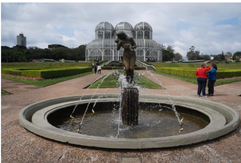
Figura 4 – Estatua “Amor Materno”, en el Jardín botánico de Curitiba/PR