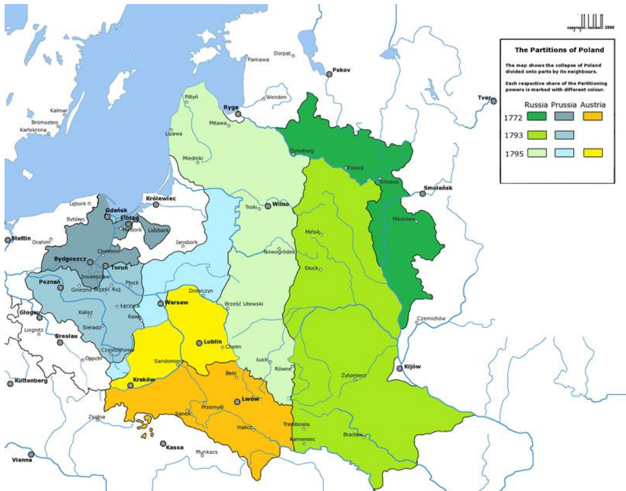
Figura 1 – Mapa de la partición de Polonia