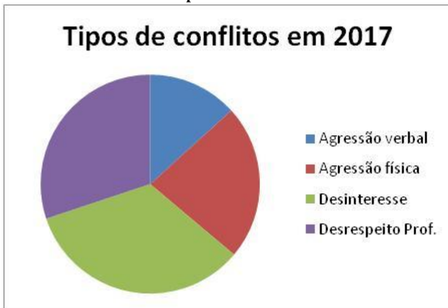
Gráfico 3 – Tipos de conflitos em 2017