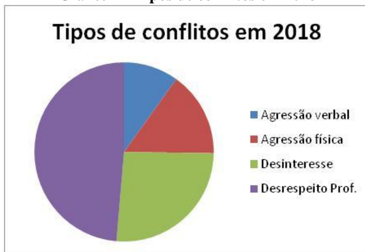
Gráfico 4 – Tipos de conflitos em 2018