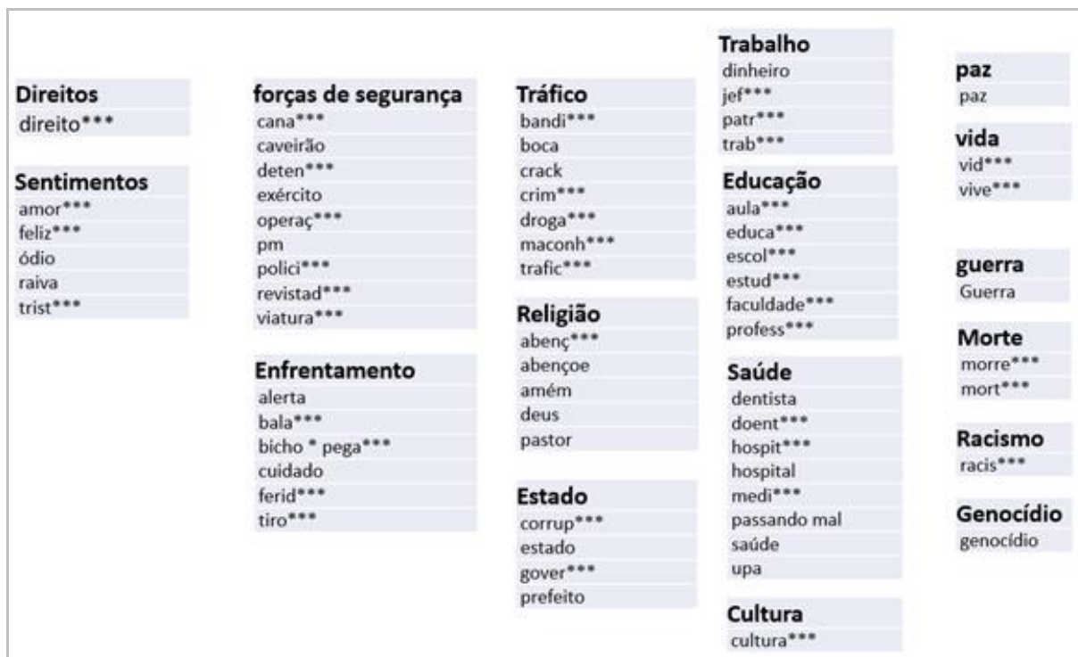
Figura 1 -Temas e termos na proposta de categorização de publicações coletadas. Monitoramento do Twitter durante uma ocupação militar numa favela carioca (agosto 2017) 9 .

nem exaustiva. Também não seguiu um referencial teórico-metodológico específico. Na Figura 1 apresenta-se o esquema categorial proposto: